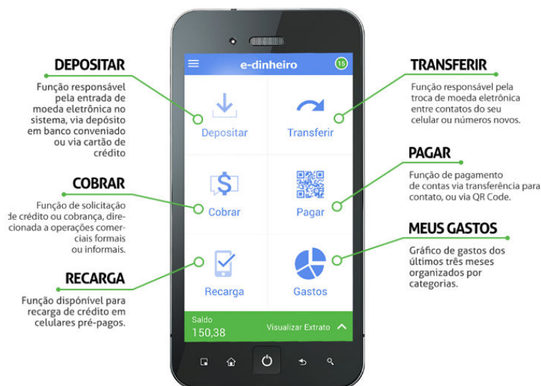
Figura 4. Plataforma E-Dinheiro e funções do aplicativo para smartphones.