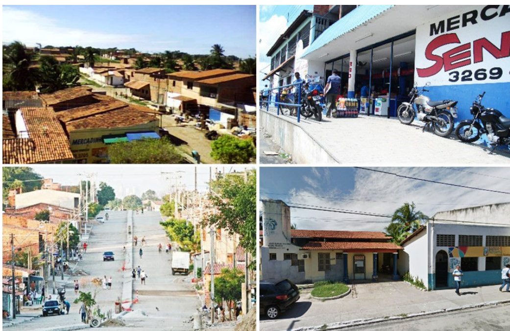
Figura 3. Conjunto Palmeira entre 2013 e 2015.