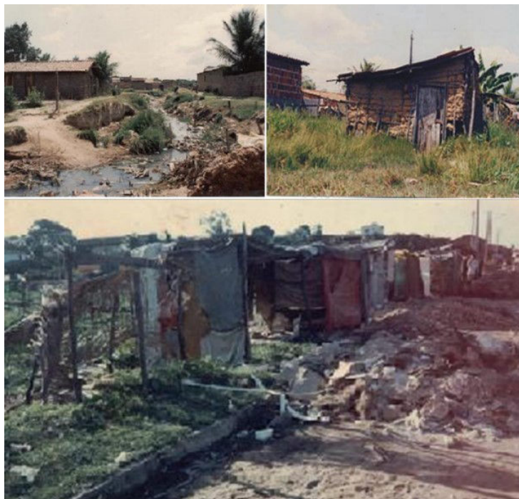
Figura 1. Conjunto Palmeira na década de 70.

A decisão, além de imediata, precisava ser definitiva!