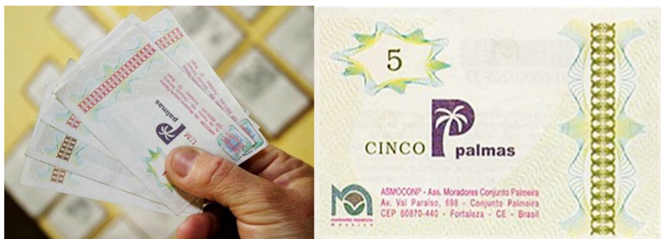
Figura 2. Moeda Palmas.