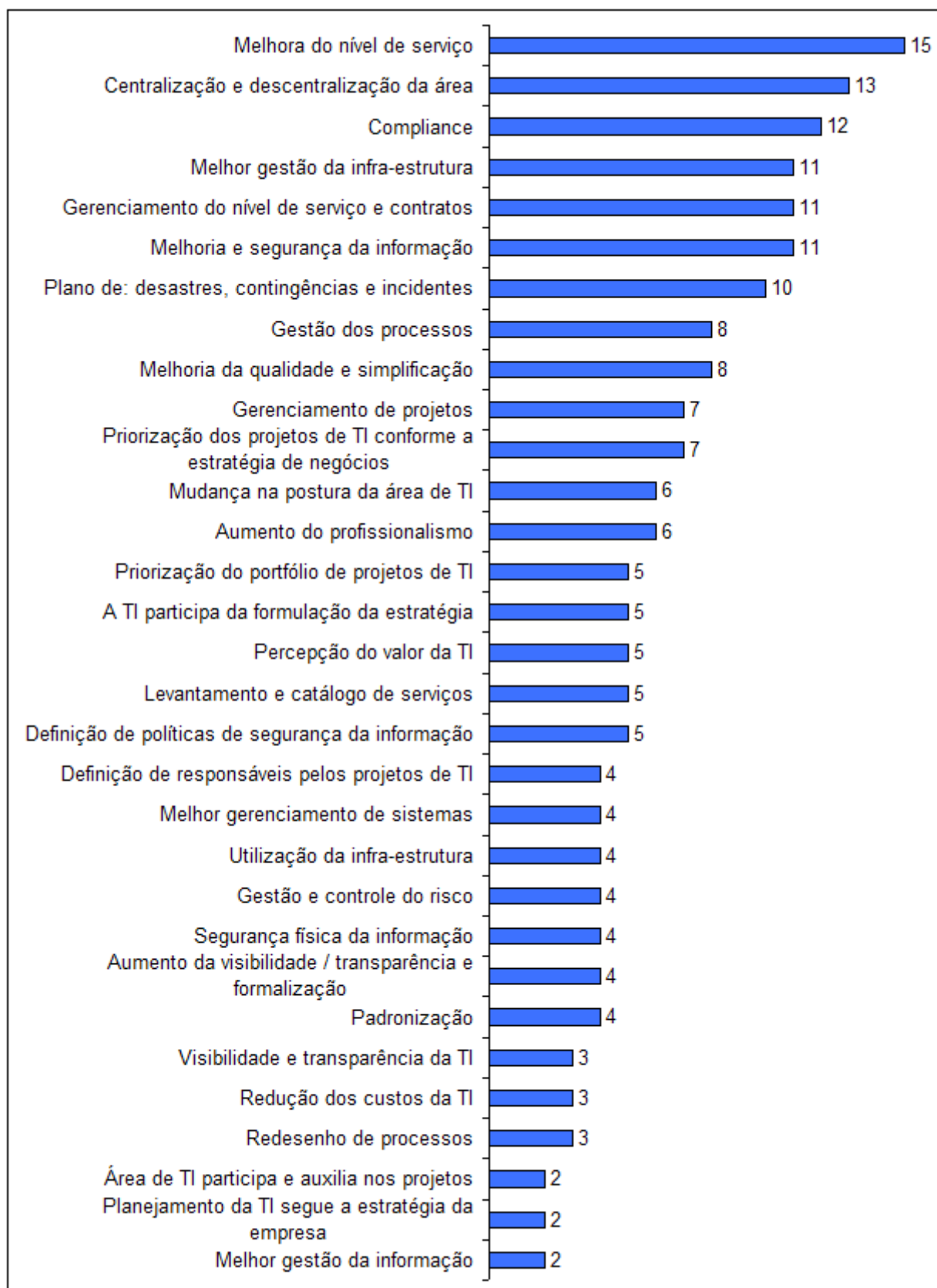
Figura 3 – Benefícios da governança de TI associados às empresas analisadas