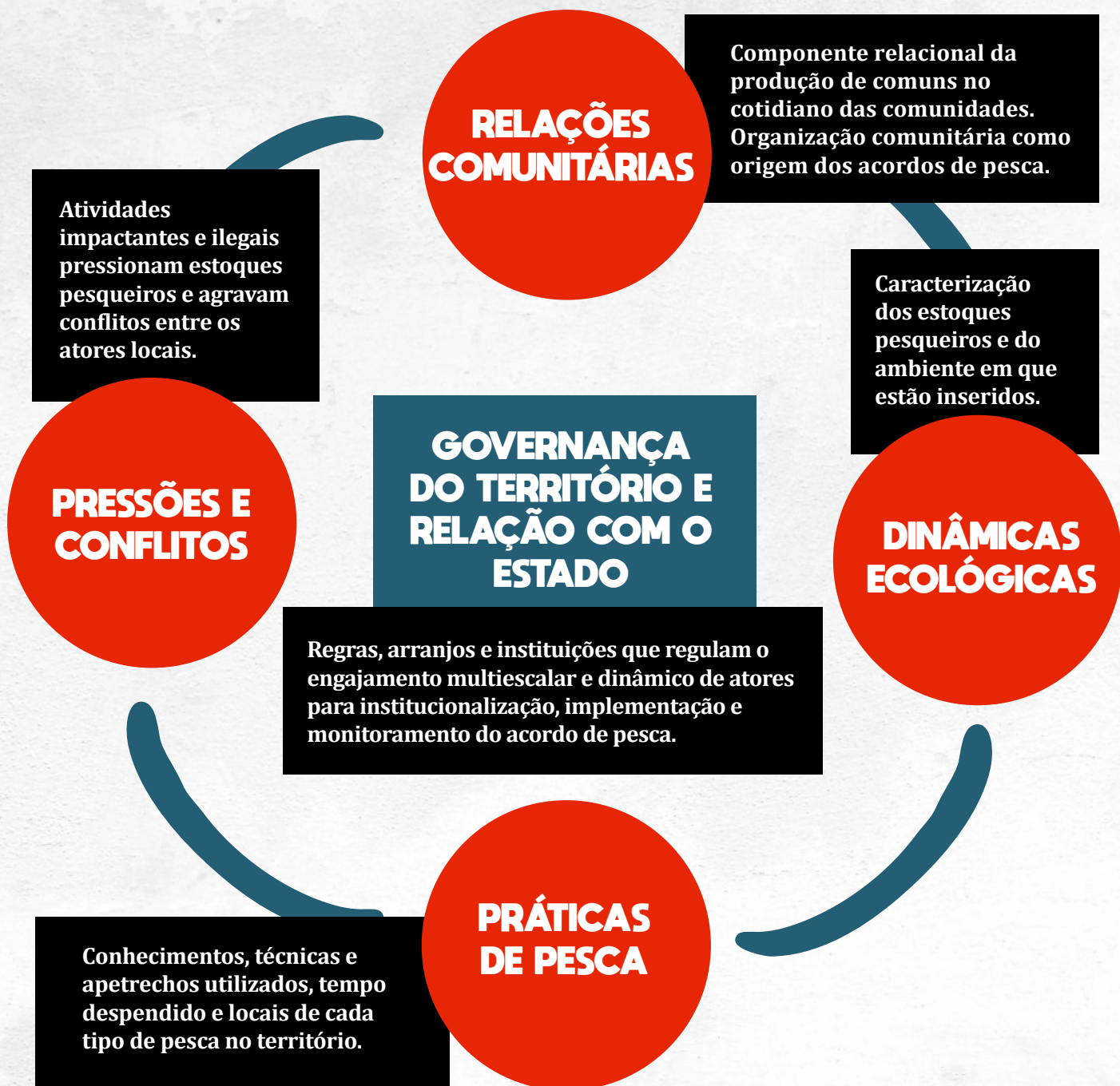
FIGURA 2: Dimensões de análise sobre a implementação de acordos de pesca.