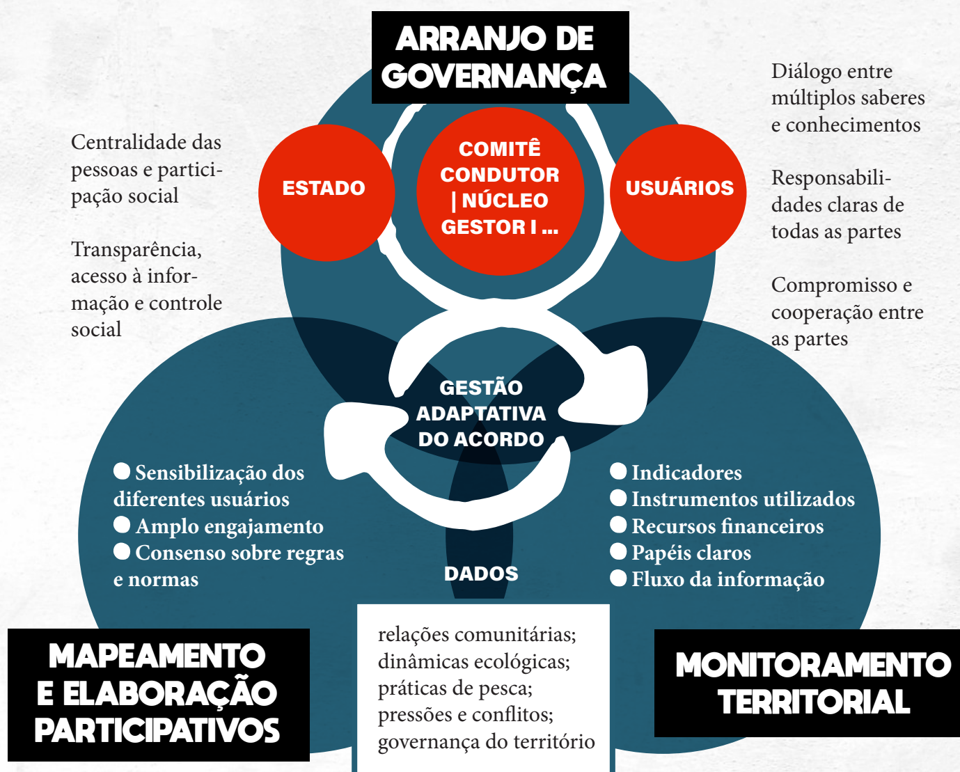
FIGURA 3: Caminhos para elaboração e implementação de acordos de pesca.

Ao ampliar a compreensão sobre a efetividade dos acordos de pesca para o ordenamento territorial e a conservação socioambiental a partir de um processo participativo e com governança instituí-