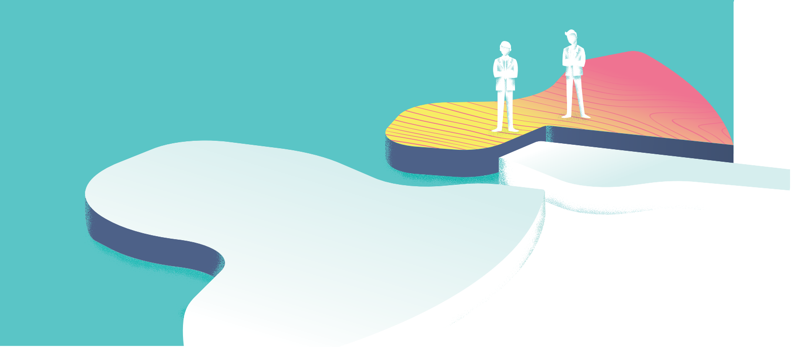
QUADRO 1 | TEORIA DE CAPITAIS DE BOURDIEU