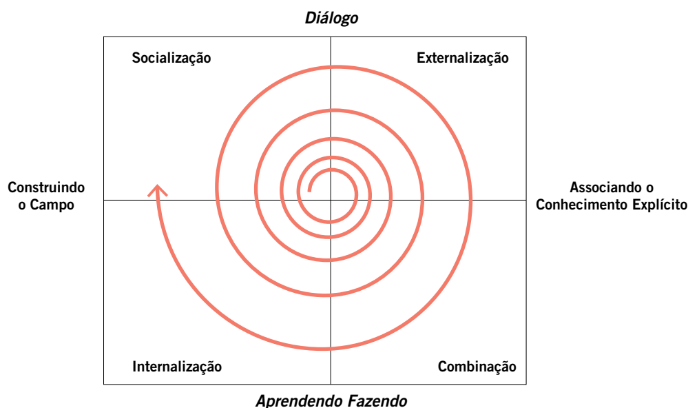
FIGURA 1 | ESPIRAL DO CONHECIMENTO

Já o estágio de Externalização se caracteriza pelo tensionamento entre conhecimento tácito e explícito. Isso acontece com a exposição dos participantes a ideias, conceitos, vivências e experiên-